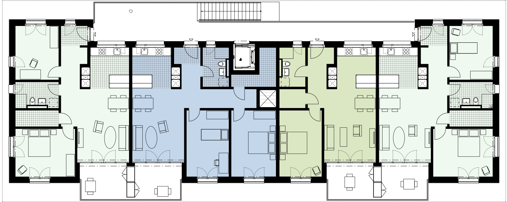
Wohnung 5 3 Zimmer Wohnung 81m 2 Keller 5 (16m 2 )