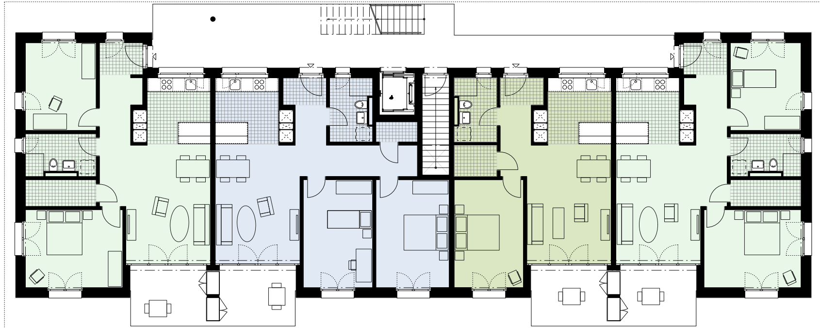
Wohnung 1 3 Zimmer Wohnung 81m 2 Keller 2 (13.7m 2 )